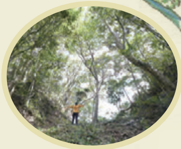
ほりきり ナンゲシク遺跡群の堀切