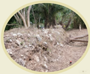
どるい 親川グスク遺跡の土塁