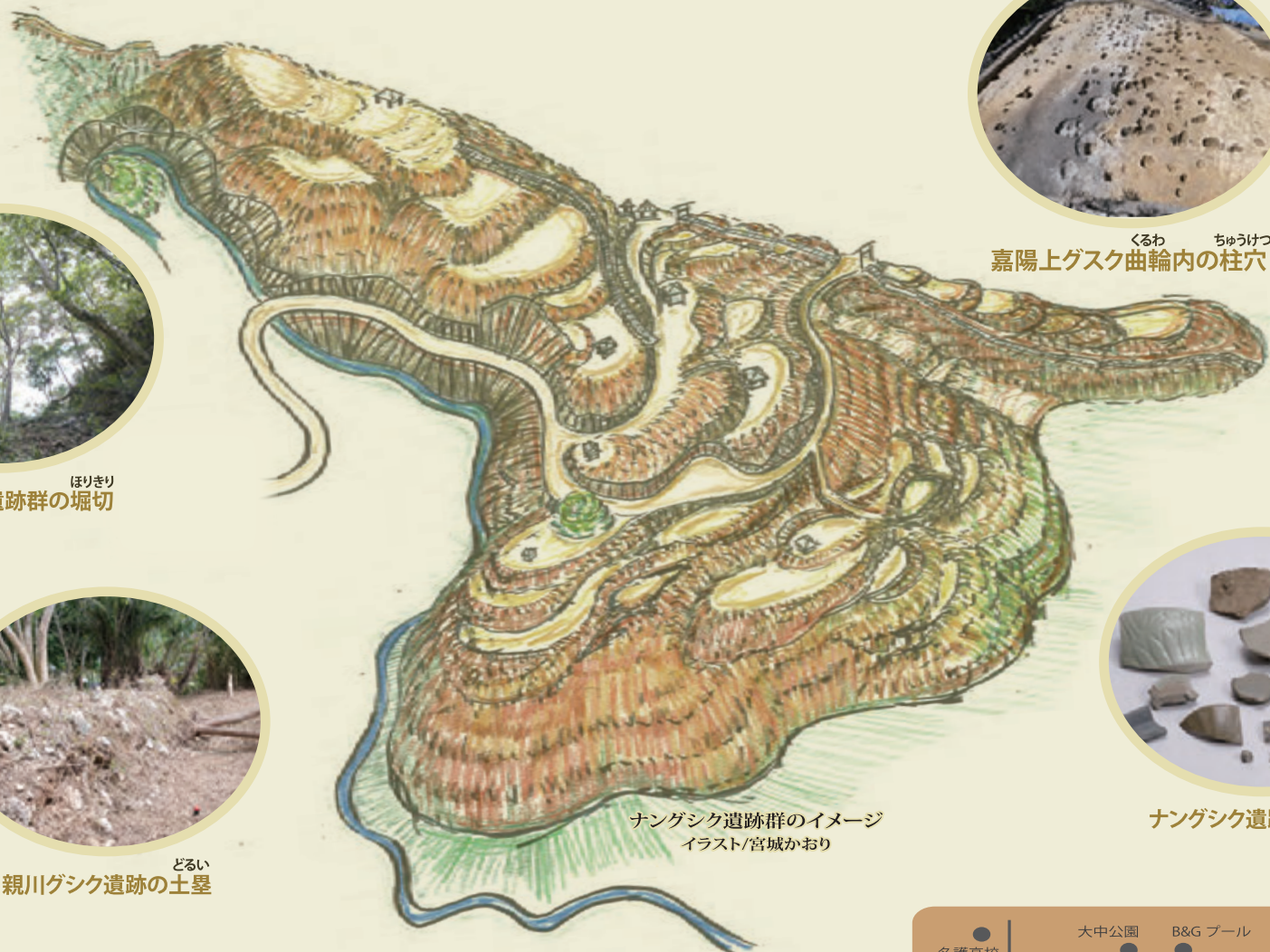
ナンゲシク遺跡群のイメージ イラスト/宮城かおり

日時：令和5年11月28日～令和6年1月21日 10時～18時(入館は17時30分まで)