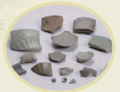
ナンゲシク遺跡群の遺物