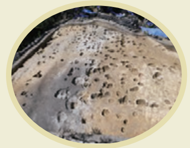
くるわ ちゅうけつ 嘉陽上グスク曲輪内の柱穴