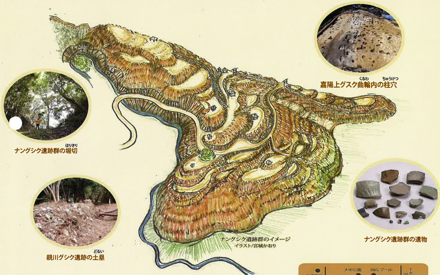
くるわ ちゅうけつ 嘉陽上グスク曲輪内の柱穴