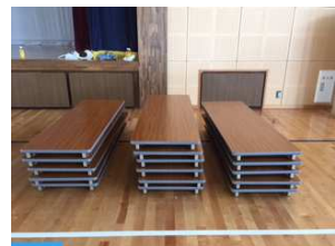
会議用テーブル(屋部小)