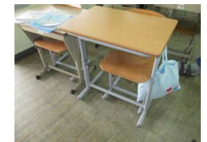
生徒用机・イス大宮小