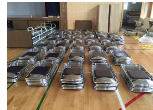
折りたたみイス(屋部小)