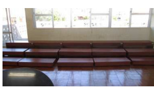
多目的ひな段(久辺中)