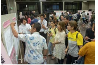
第3回よってかたってゆんたく