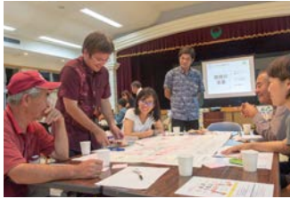
第1回よってかたってゆんたく

「よってかたってゆんたく」は、市民のみなさんが地域や名護市の未来を考え話し合っていくための場で、これまで11月・2月・4月にワークショップを開催し地区の未来について話し合ってきました。これまでの3回のワークショップを通じて各地区の「地区の未来」とそれを実現するための「重点プロジェクト」についてまとめました。