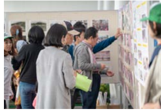
第2回よってかたってゆんたく（カフェイベント・ワークショップ）