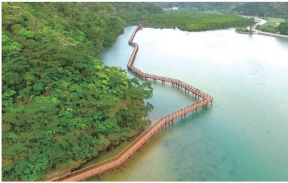
大浦マングローブ林自然体験施設等整備事業(北連) (平成25年度~平成27年度)