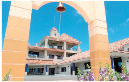
屋我地支所建設事業 (平成24年度~平成28年度)