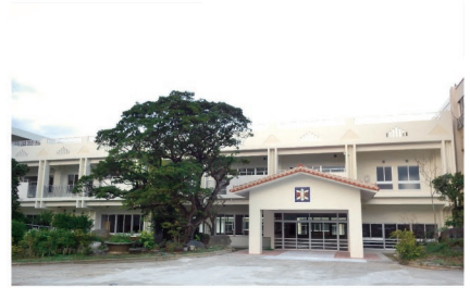
東江小学校校舎改築事業 (平成24年度~平成27年度)