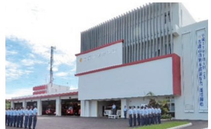
消防庁舎建設事業費 (平成24年度～平成28年度)