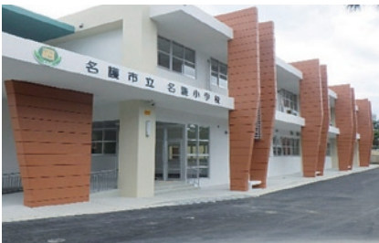
名護小学校校舎改築事業 (平成26年度～平成28年度)