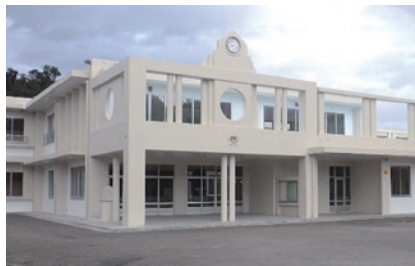
羽地中学校校舎改築事業 (平成26年度～平成28年度)