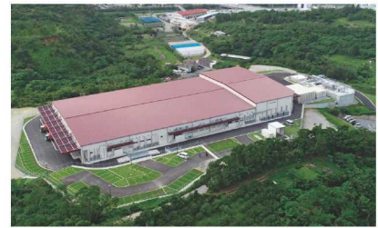
名護市食鳥処理施設整備事業(平成28年度～令和元年度)