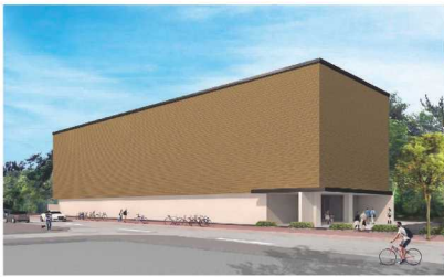
名護・やんばるの自然と文化拠点施設整備事業(新設博物館)※完成予想図(令和元年度～令和3年度)