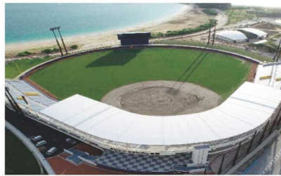
21世紀の森公園建設事業(名護市営球場整備)(平成28年度～令和元年度)