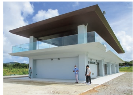
スポーツコンベンション施設整備事業 (令和元年度～令和4年度)