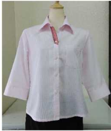
~さんぐわーストラップ~