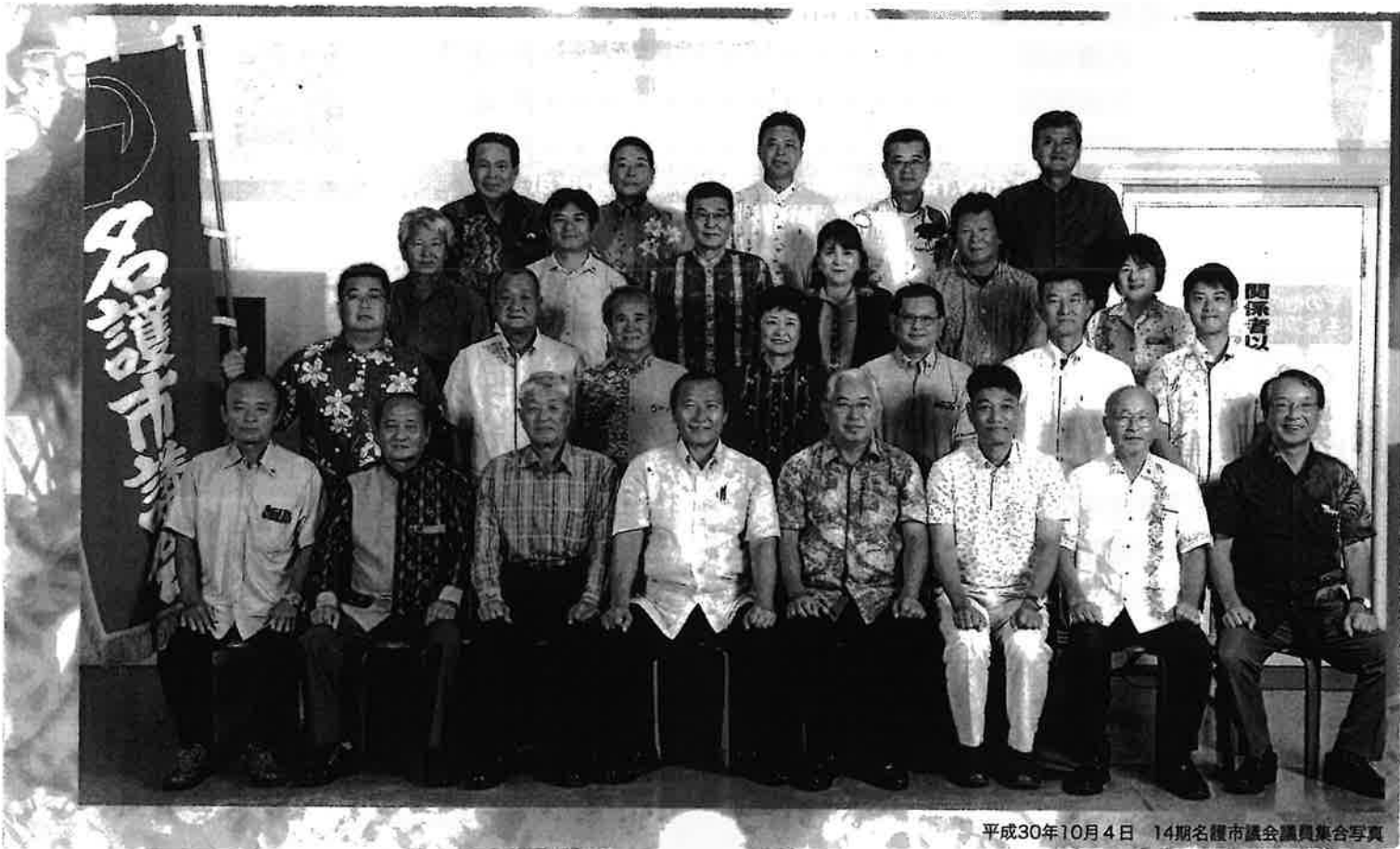
平成30年10月4日 14期名護市議会議員集合写真

開催日 平成30年11月27日(火) 屋我地地区 平成31年2月12日(火) 名護地区、屋部地区 平成31年2月13日(水) 羽地地区、久志地区