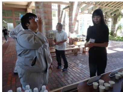
◎ 利き水チャレンジ ◎