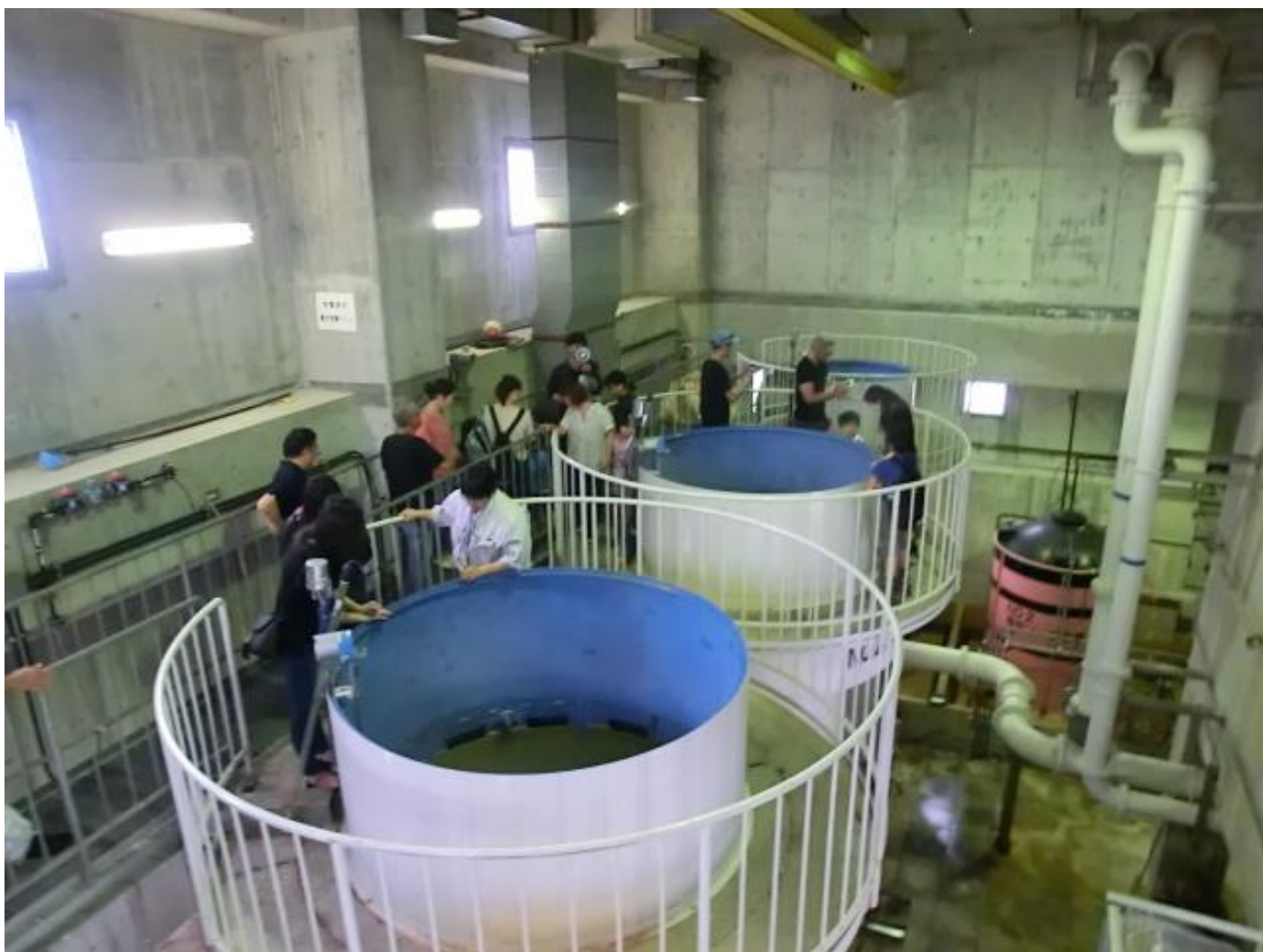
表紙写真：中央浄水場施設見学

給水人口 61,065 人 給水世帯 29,029 世帯 令和元年10月31日現在