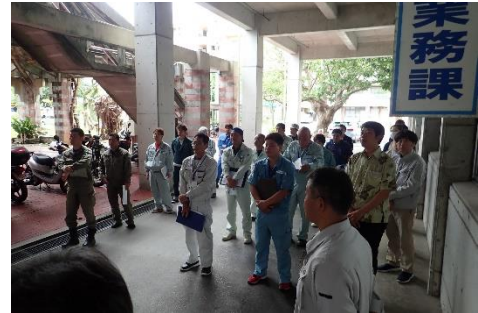
☆ 無料点検出発式 ☆

今年度は、初めてイオン名護店でパネル展を行い、多くの市民の方に見ていただくことができました。また、県立名護商工高等学校で配管実技体験を行い、21名の高校生や一般の方が参加してくれました。