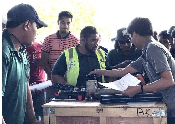
管接続の内部研修