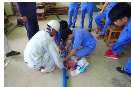
◇ 配管実技体験 ◇