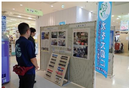
○ パネル展 ○