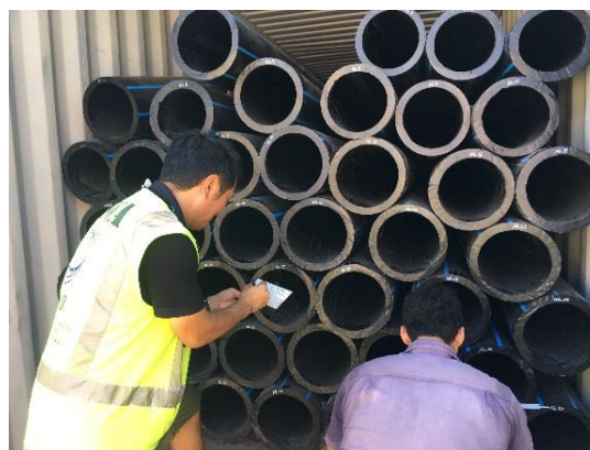
輸入された管材のチェック