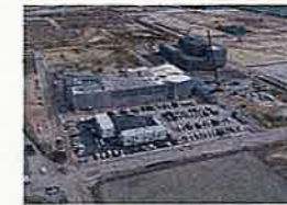
建設中の双葉町産業交流センター(右)

3月7日に常磐双葉IC供用開始、3月14日には新双葉町駅開業。常磐双葉ICと中野地区復興産業拠点を結ぶ復興シンボル軸も一部で供用開始し、産業拠点内の産業交流センターは、2020年夏頃の開業を目指し建設工事が進められています。