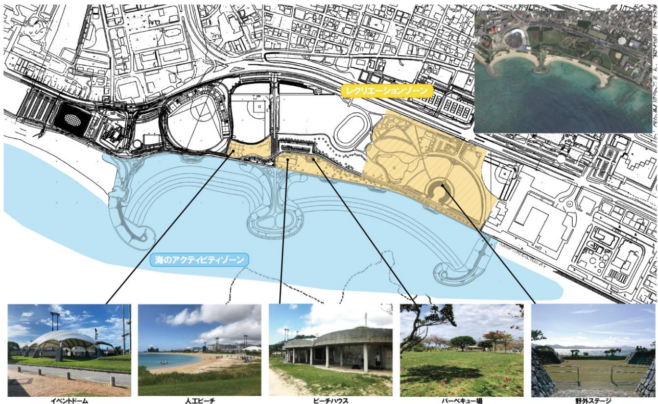
図 トライアル・サウンディング実施エリア

※現地説明会については、トライアル・サウンディングの募集を随時受け付けるため、合同の現地説明会は開催しません。不明点等ある場合は、「4. 質問受付」で対応します。なお、現地見学については、一般利用の範囲内であれば可能です。