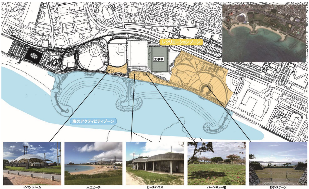
図 トライアル・サウンディング実施エリア