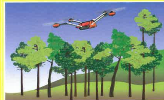
ドローンによる監視

感染拡大を防ぐには感染木の早期発見は重要です。感染源となる枯死木をいち早く発見するため、地上部から双眼鏡を使った調査を主に行っています。また、見落としがないようドローンなどによる空中写真調査も補足的に行っています。沖縄本島最北部エリアや本島周辺離島、先島諸島にお住まいのみなさまも、被害木を発見しましたら、沖縄県への通報協力をお願いします。