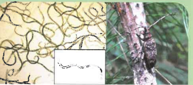
マツノザイセンチュウ マツノマダラカミキリ

マツを枯らす病原体は「マツノザイセンチュウ」という1mmにも満たない線虫です。この線虫を運ぶ「マツノマダラカミキリ」という昆虫を便宜的に「松くい虫」と呼んでいます。正式には『リュウキュウマツ材線虫病』という伝染病です。