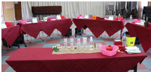
↑会場も素敵にセッティング