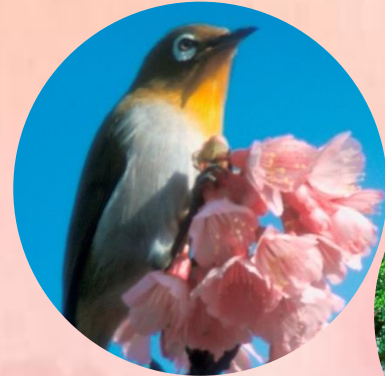
リュウキュウメジロ