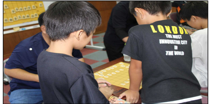
座学で学んだ戦略を踏まえて…いざ実践！