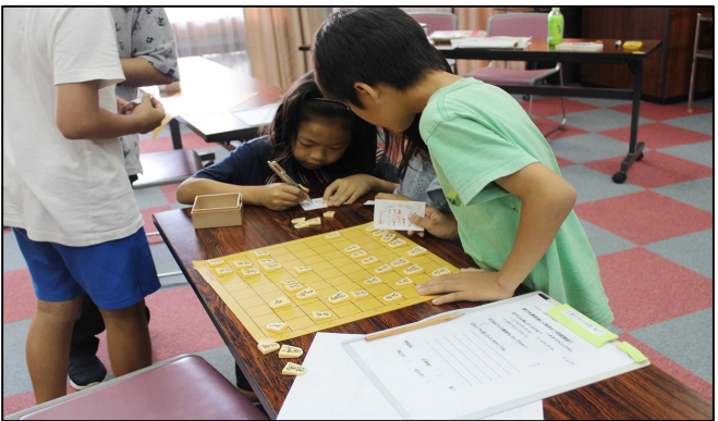
棋力認定証を作ってもらい、段位がついたことで自信に満ちています。