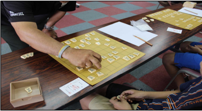
講師と対局！終盤にじわじわと追い詰められて負けてしまいました。