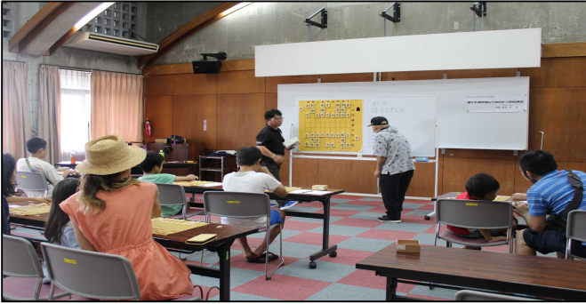
簡単で実践でも活用できる戦法を学びました