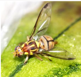
セグロウリミバエ成虫