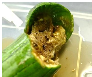
加害されたヘチマ