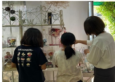
身近なお仕事観察中

行っている業務（仕事）が一連の流れの中でどのような意味があるのかを説明してください。当日のスケジュールにお困りでしたらご連絡ください