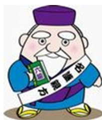
名護市ゆるキャラ「なぐうえーかた」