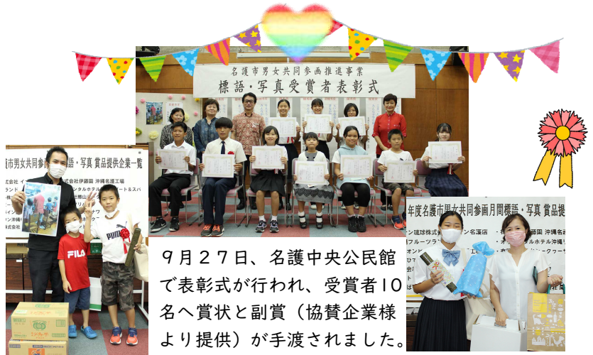
9月27日、名護中央公民館で表彰式が行われ、受賞者10名へ賞状と副賞（協賛企業様より提供）が手渡されました。