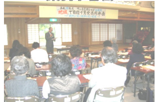
男女共同参画講演会