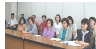
産婦人科医師要請行動(県)