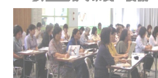
研修会参加の皆さんの真剣な様子