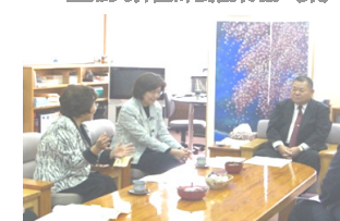
女性登用で市長へ要請