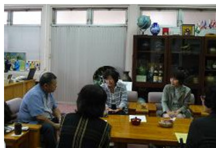
市も努力しますのでよろしく