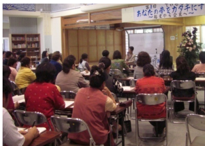
講演に聴き入る参加者の皆さん

2回・3回と充実させる研修会を開催しますので注目です2回目は9月5日の予定です！！