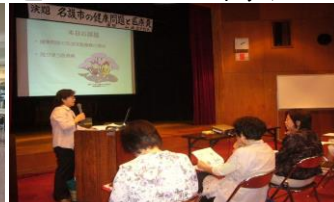
「健康問題と医療費」講演会