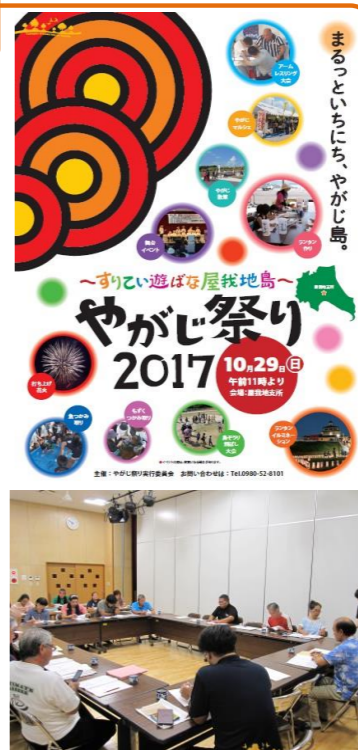
第6回実行委員会の様子→

やがじ祭り開催に向けて区長さんをはじめ地域のみなさんが集まり、実行委員会を立ち上げました。それぞれイベントごとに話し合い、企画・運営を行います。丸々1日を屋我地島で楽しく過ごしてもらおうというコンセプトでポスターも完成。祭りを盛り上げる為に、気持ちをひとつにして会議を進めています。