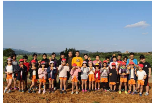
▲ジャガイモを片手にハイポーズ