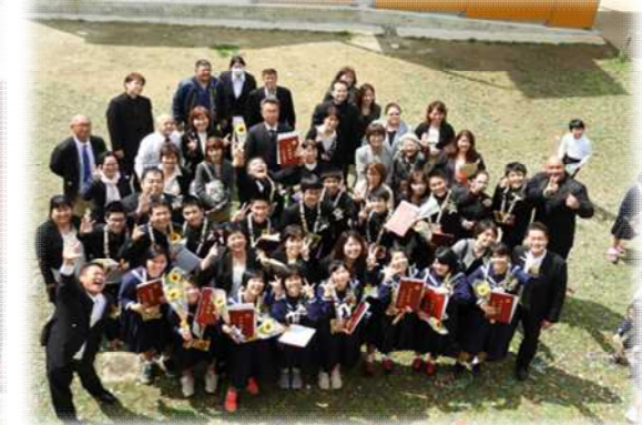
▲卒業生・保護者 集合写真