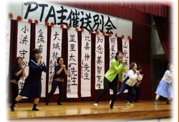
▲華麗なるダンスの様子