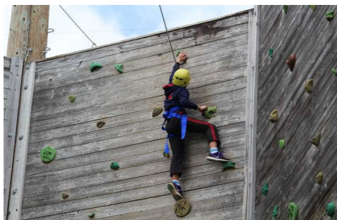
▲クライミングウォール