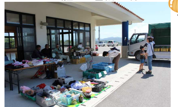
▲3月18日(日)の屋我地島朝市の様子