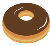
チョコドーナツ 砂糖26g