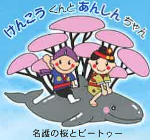
名護の桜とビートル