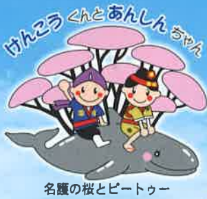
名護の根とビートルー