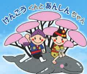
名護の桜とピートゥー