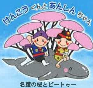
名護の桜とビートゥー

国保加入状況 国保世帯数 / 10,266世帯 (11月末現在) 被保険者数 / 17,614人 退職者 / 124人 一般 / 17,490人