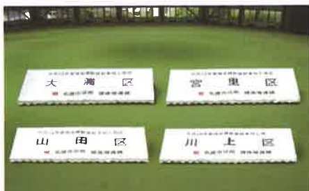
※平成28年度受診率向上表彰地区

名護市では、受診率が大きく向上した地区を表彰し、記念品としてテントを贈呈しています。地域のみなさんで特定健診を受診し地区の受診率向上に協力しましょう。