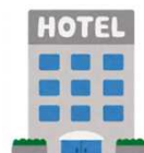
感染者等への支援に伴う職員宿泊費