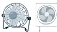
扇風機・換気設備等の設置