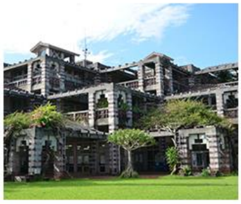
名護市役所マップ