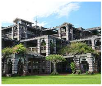
名護市役所マップ