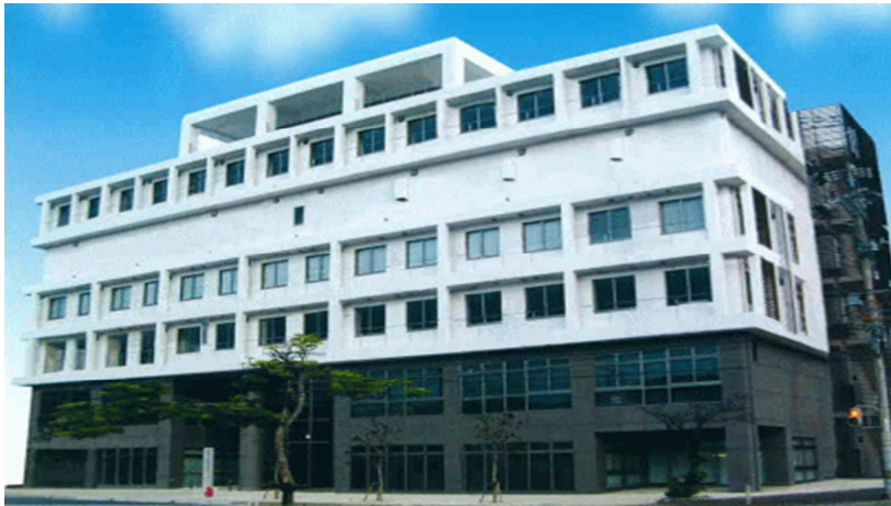
名護市 地域経済部 商工・企業誘致課