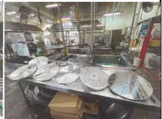
屋部学校給食センター(フードスライサー一式)