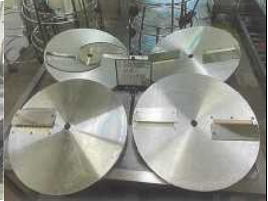
羽地学校給食センター(フードスライサー一式)