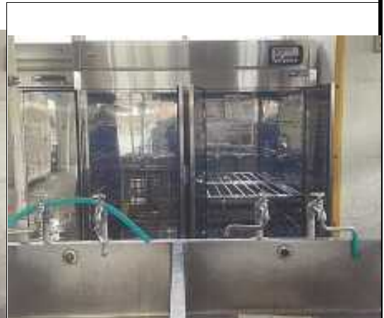
屋部学校給食センター(食器消毒保管庫一式)