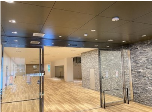
1階 総合エントランス