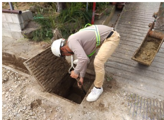
【道路と接している近隣住民から要望のあった箇所】