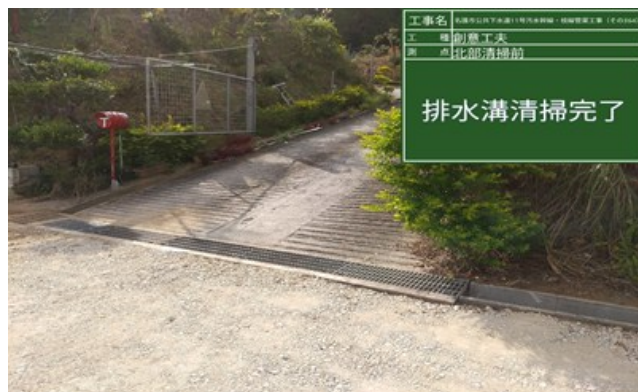
【施工区間の側溝を清掃した状況】