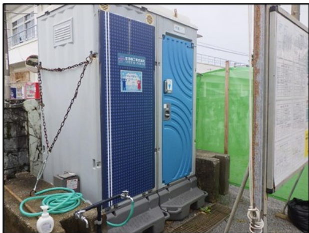
【現場事務所兼休憩所：快適トイレ】