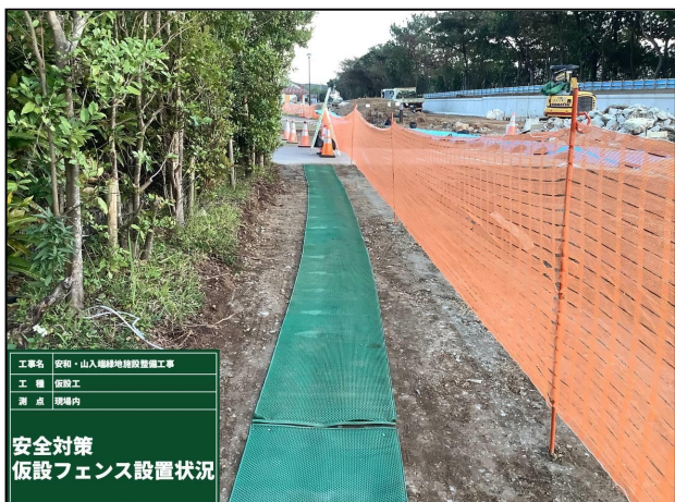
【仮設フェンス・歩行者用マット設置状況】