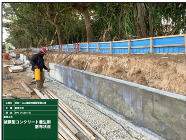
【被膜型コンクリート養生材散布状況】