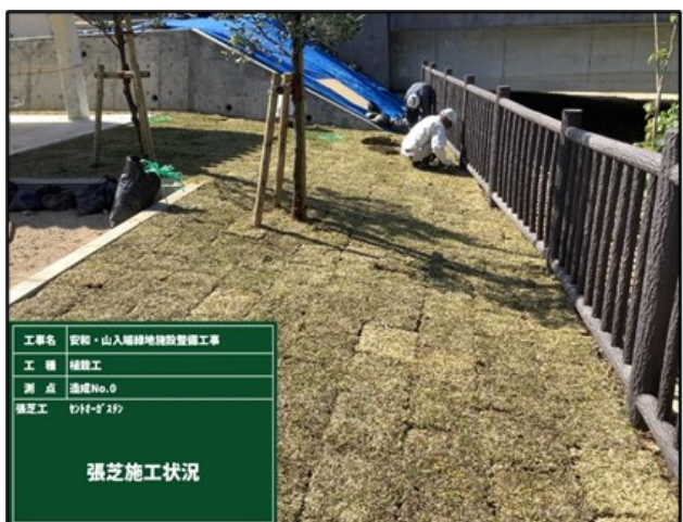
【張芝施工状況：100%張り】