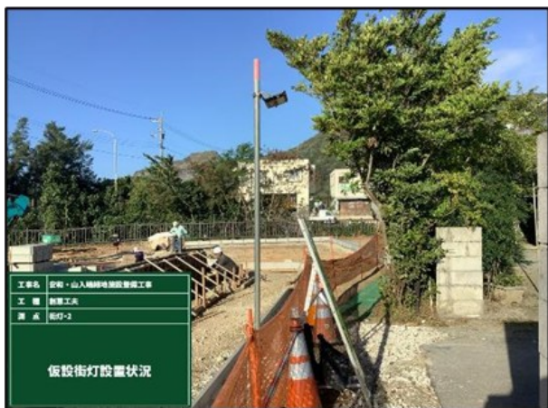
【仮設街灯設置状況】

② 夜間時間帯における防犯と安全な通行を確保するため、ソーラー式街路灯を設置した。