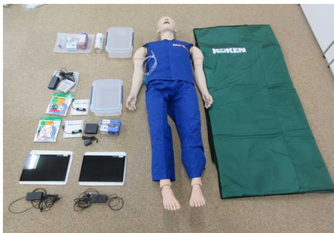
救急救命処置シミュレーター