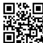
つうえんポータル

右記の二次元コードを読み込み、つうえんポータルにアクセスし、その画面にてお住まいの自治体を選択し、利用申請をしてください。