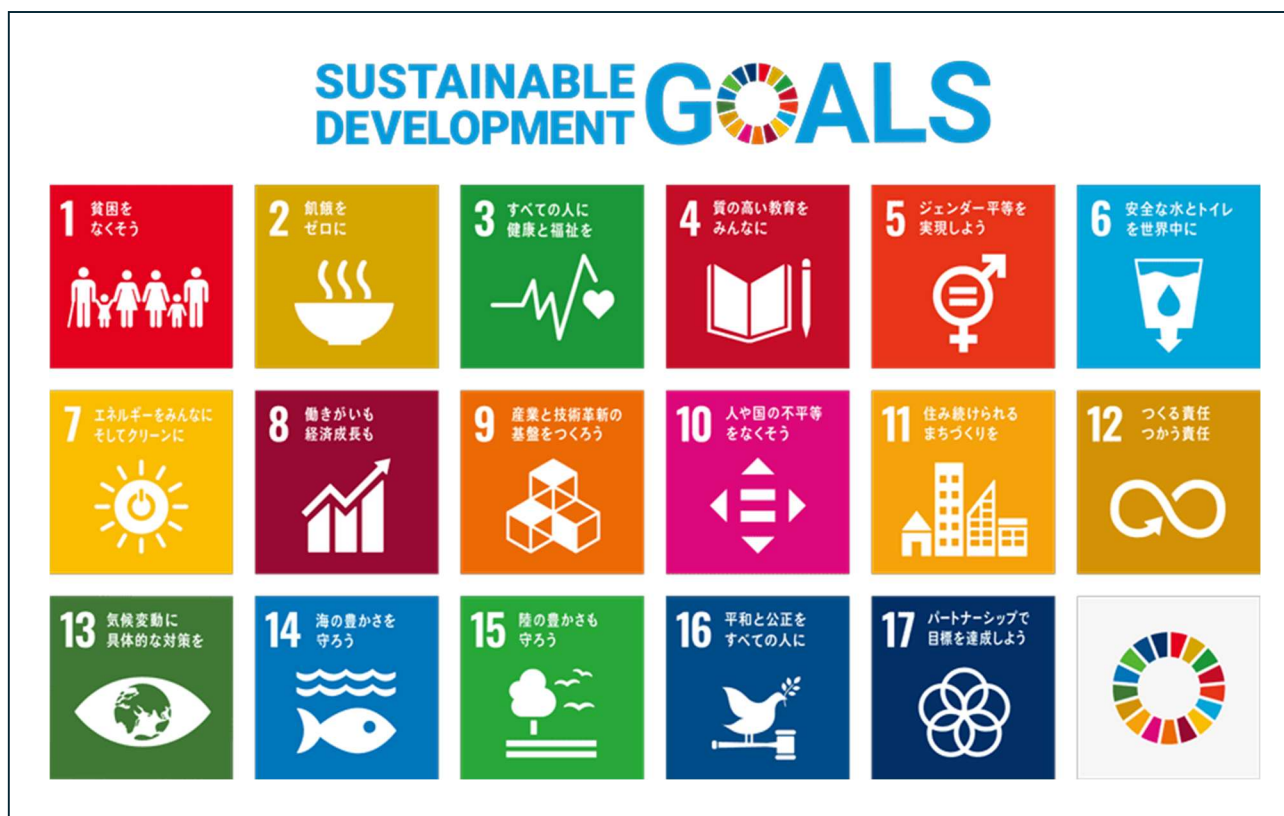
図 1.3 SDGs（持続可能な開発目標）の17のゴール

SDGsの理念は本計画の各施策を進めていく上でも重要な視点であることから、本市においてもSDGsの理念を踏まえながら各取組を推進し、「持続可能なまちづくり」と「地域活性化」の実現を目指します。