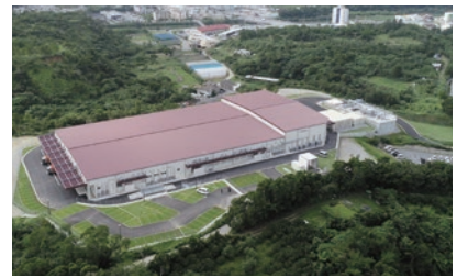
名護市食鳥処理施設整備事業 (平成28年度～令和元年度)