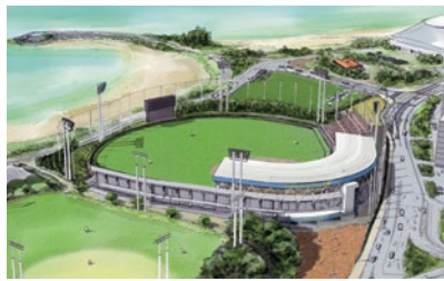
21世紀の森公園建設費(名護市営球場整備) (平成28年度～令和元年度)※完成予想図