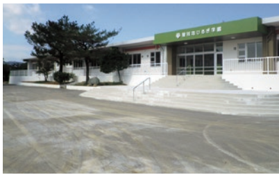
屋我地小中一貫校校舎改築事業(小学校) (平成28年度～令和元年度)