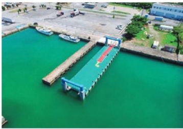
名護漁港浮桟橋整備事業 (令和4年度～令和6年度)