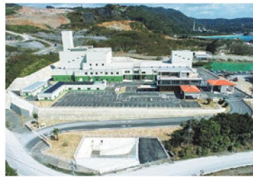
新設廃棄物処理施設整備事業 (平成21年度～令和6年度)