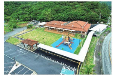
二見以北交流機能強化推進事業(交流拠点) (令和4年度～令和6年度)