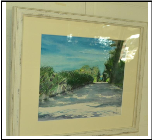
道のむこうは…(久志)