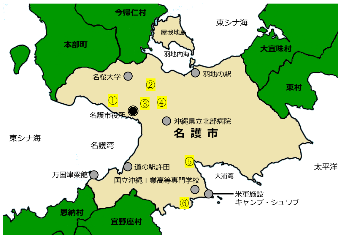
①タピックススタジアム名護