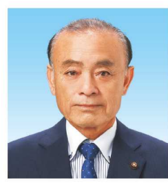
名護市議会議長 金城 隆

私たち議会は、昨年九月の市議会議員選挙において皆様の御支援を賜り、二十六人の議員が誕生し、私も議員の推挙を得て、第十七代名護市議会議長に就任いたしました。新年を迎え、本市の一層の躍進の年となるよう決意を新たにしたいと考えております。