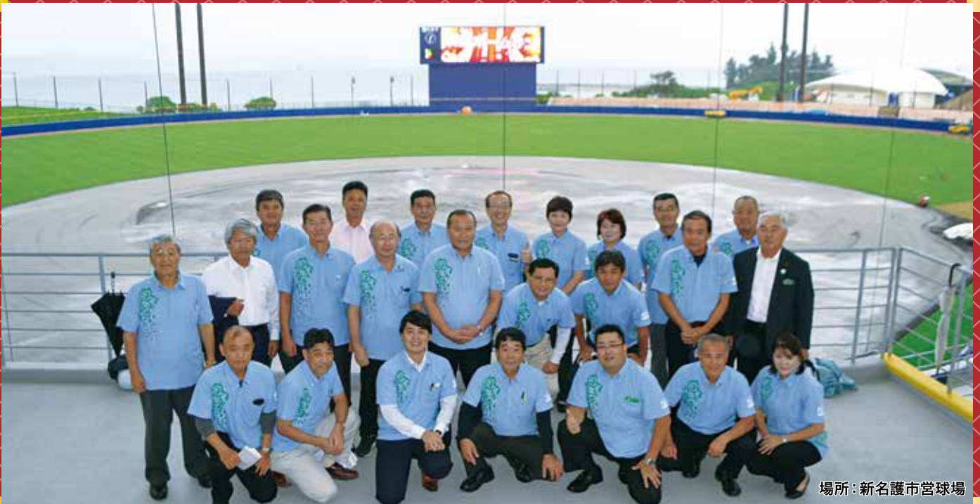
場所：新名護市営球場